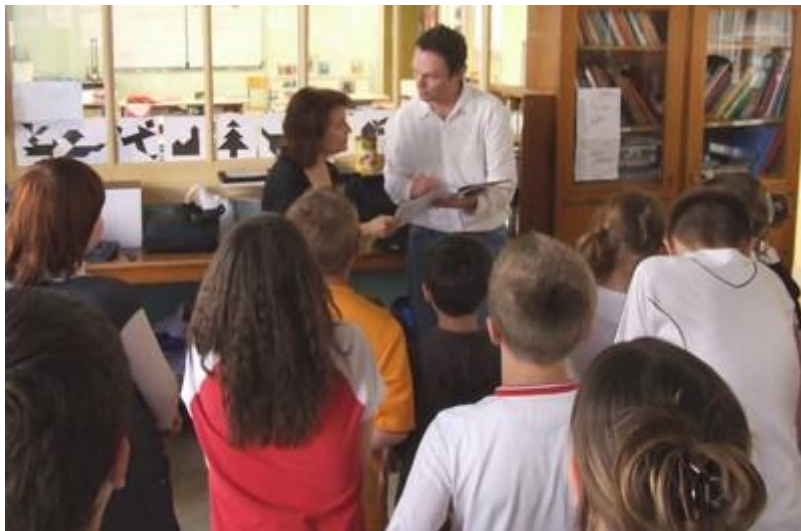
Petite précision dans la partition